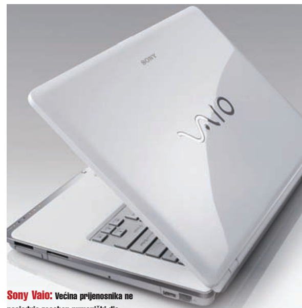
Sony Vaio: Većina prijenosnika ne posjeduje zaseban numerički dio tipkovnice.

Treće, da bi se automatski pokrenula kod pokretanja operativnog sustava, najbolje vam je ubaciti zapis u registry. Procedura je sljedeća: Start -> Run -> regedit.exe -> HKLM\Software\Microsoft\Windows\CurrentVersion\Run . Tamo kliknete na Edit -> New -> String, preimenujete ga u npr. "Kiosk" te mu dodijelite vrijednost "iexplore -k....." ili kako će već glasiti komanda koju želite (morate unijeti i navodnike).