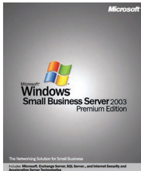
Small Business Server: Nešto se može iščitati i iz log zapisa.

Postoji urbani mit o serveru koji se gasio svakog utorka u 15:00. Rješenje tog mita je bilo uvjeriti tetu čistačicu da ne koristi utičnicu servera. Ukoliko vaše tete čistačice ne dolaze u firmu tako rano ili ne koriste te utičnice, provjerite aplikaciju od UPS-a, postavke samih Windowsa (profile za štednju energije), postavke u BIOS-u. Nešto se sigurno može iščitati i iz Event log zapisa i dati vam neku ideju zašto se to događa.