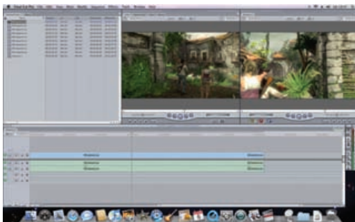
HD Video: Za dekodiranje HD video zapisa potrebno vam je dovoljno snažno računalo.

Pozdrav, pokušavam sastaviti nekakvu konfiguraciju PC-a, ali mi ne ide. Konkretno me zanima PC za rad u grafičkim programima, obradu