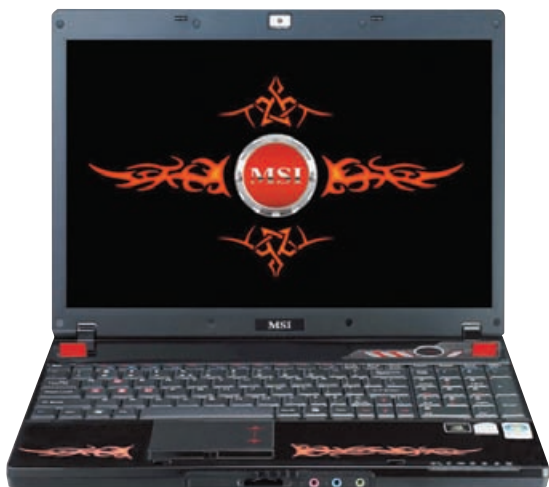
MSI GX610: Jedan od najboljih gamerskih prijenosnika na tržištu.

Poštovani, koristim prijenosno računalo MSI GX610. Problem mi se javio prilikom bootanja sa CD-a jer je u BIOS-u na prvom mjestu bootanje sa hard diska, a ne mogu promijeniti redosljed bootanja, tj. ne mogu namjestiti da